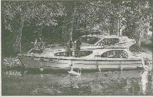
AMBIENTE Senza patente lungo i fiumi e la laguna